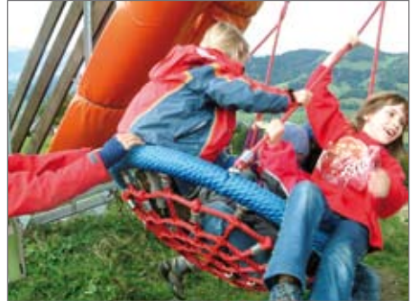
voll im Schuss