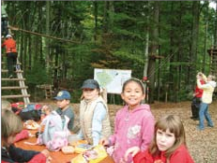
Jugi 1 Stärkung vor der Wanderung Jugi 2 bereit für den Kletterparcour