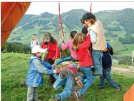
Uebung auf dem Erlebnispfad