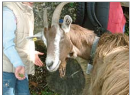
hier wird nicht gemeckert