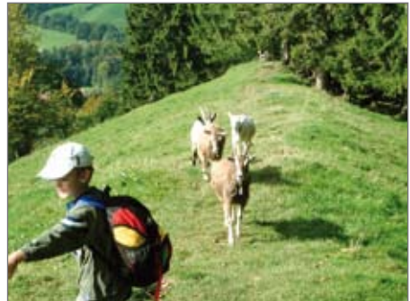
Zottel, Zick und Zwerg folgten uns über jeden Berg